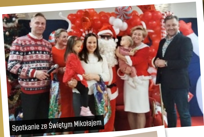
Spotkanie ze Świętym Mikołajem