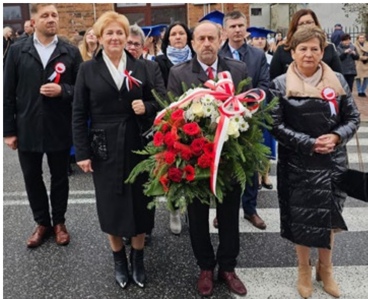
Przepiękne występy artystyczne z tej okazji zaprezentowały szkoły z terenu Miasta i Gminy Łopuszno