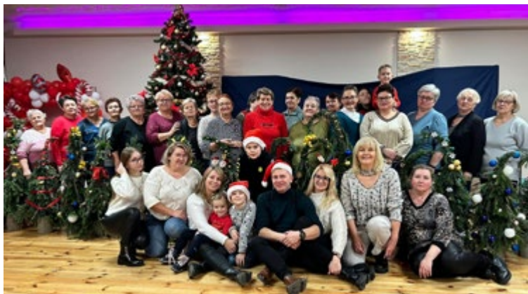
Uśmiech na twarzy oznaką szczęścia uczestników warsztatów

Święta Bożego Narodzenia to szczególny czas. Zapach piernika, przystrójona choinka, piękne ozdoby - to buduje wyjątkowy, świąteczny klimat. I właśnie po to, aby przygotować się na nadchodzące święta, kolejny raz - w dniu 12.12.2023r. w Miejsko Gminnym Ośrodku Sportu i Rekreacji odbyły się Wielopokoleniowe Warsztaty Świąteczne.