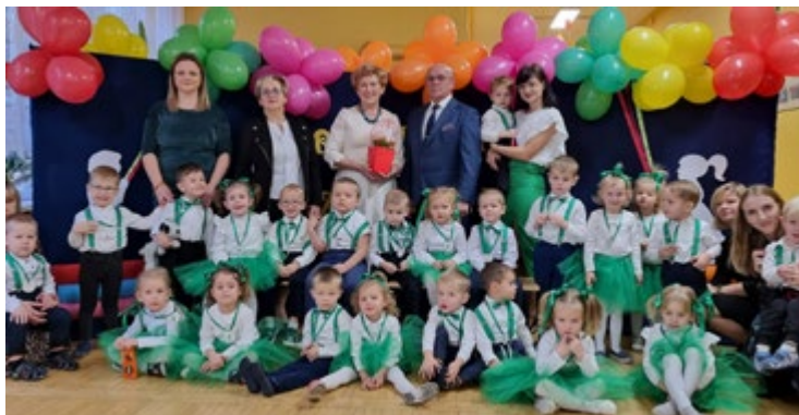
Uroczyste pasowanie na przedszkolaka dzieci ze Szkoły Podstawowej im Jana Pawła II w Łopusznie.