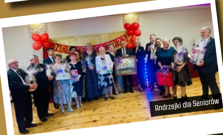
Andrzejki dla Seniorów