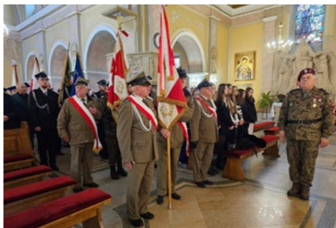
Poczty sztandarowe uświetniły swoją obecnością uroczystości