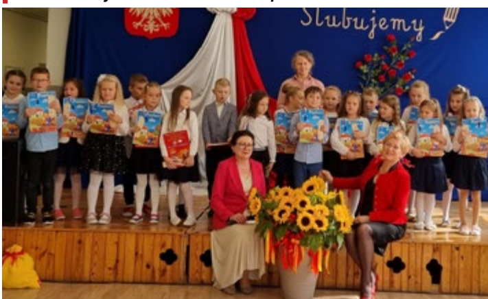
Ślubowanie pierwszoklasistów ze Szkoły Podstawowej w Gnieździskach.