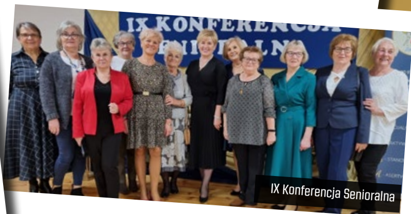
IX Konferencja Senioralna