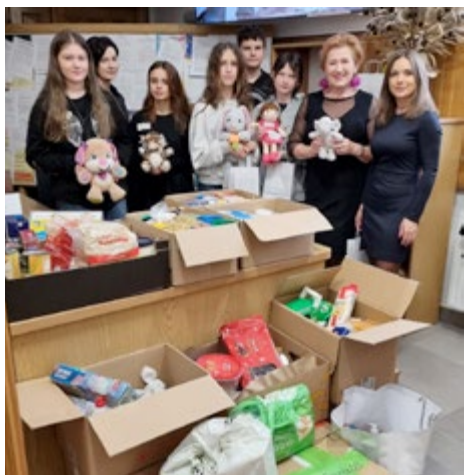
Dar serca od wspaniałych Mieszkańców Miasta i Gminy Łopuszno dla Rodaków

Dyrektorzy i wszyscy pracownicy jednostek organizacyjnych miasta i gminy Łopuszno wsparli z potrzeby serca zbiórkę przeprowadzoną w szczytnym celu. W akcję zaangażowali się również przedstawiciele młodego pokolenia. Widok postaw prospołecznych i altruistycznych wśród młodzieży z mia-