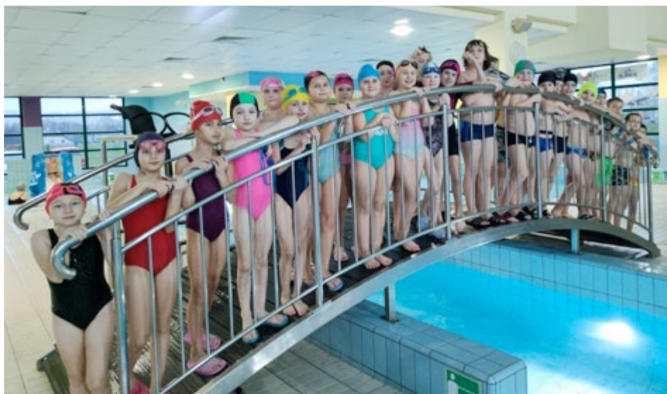
Uczniowie bardzo chętnie korzystali z zajęć na pływalni