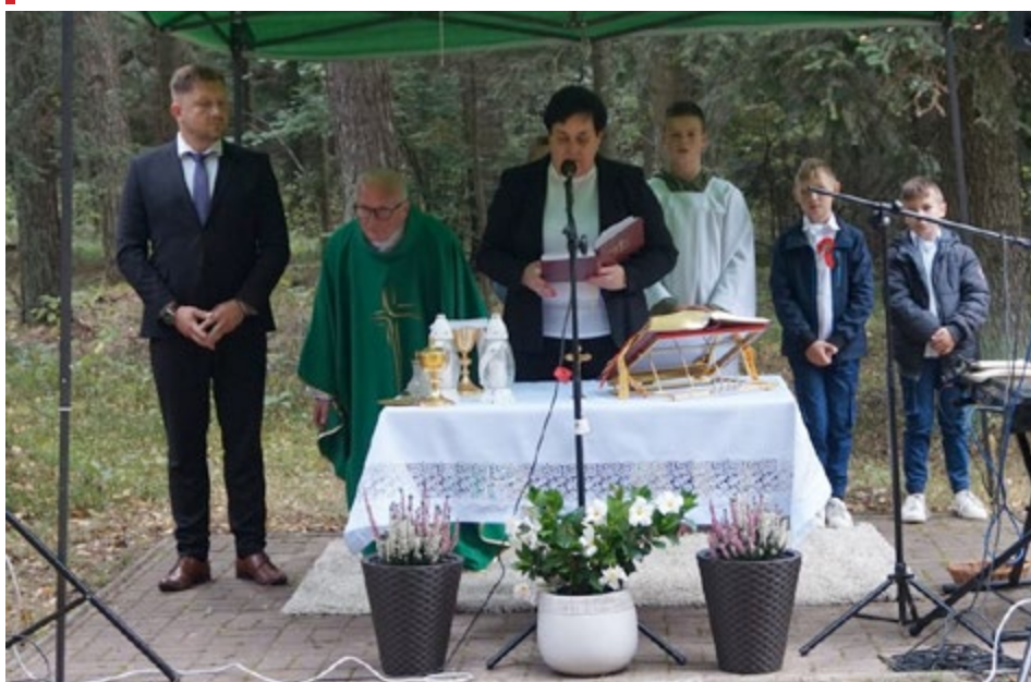
Pamięć o przodkach kształtuje naszą tożsamość

I października 2023r. w Sarbicach, pod pomnikiem ofiar II wojny światowej, odbyły się uroczystości patriotyczne, mające na celu utrwalenie pamięci o siedmiu zamordowanych mieszkańcach tej miejscowości. Zginęli z rąk hitlerowców 30 września 1944r. Na uroczystość, jak co roku, licznie