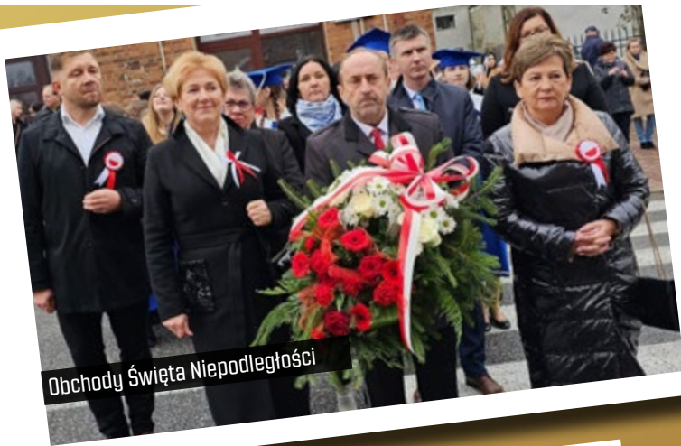
Obchody Święta Niepodległości