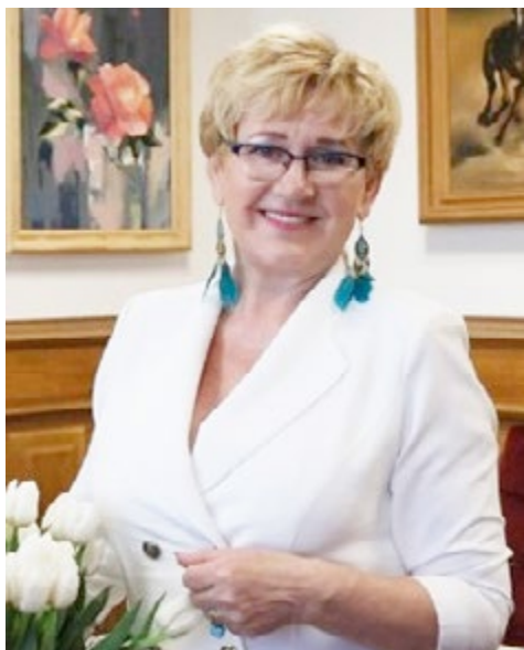
Szanowni Mieszkańcy oraz Goście miasta i gminy Łopuszno

Oddając w Państwa ręce najnowsze wydanie „Wieści Łopuszna”, korzystam z okazji, aby tradycyjnie poinformować o najważniejszych inicjatywach, które udało się zrealizować w IV kwartale 2023 roku. Sukcesywnie wdrażamy zespołowo priorytetowe zamierzenia, dążąc do tego, aby wszelkie podejmowane – dzięki doskonałej współpracy z Mieszkańcami miasta i gminy – działania podnosiły komfort Państwa codziennego życia oraz dawały zadowolenie i poczucie dumy z faktu wieloaspektowego rozwoju naszej „Małej Ojczyzny”.