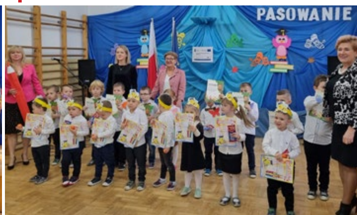
Pasowanie dzieci na przedszkolaka w Szkole Podstawowej w Dobrzeszowie.

Ś lubowanie uczniów klas pierwszych to szczególnie wyjątkowy i niezapomniany dzień dla wszystkich pierwszoklasistów. W tym dniu stają się oni pełnoprawnymi uczniami szkoły. Uroczystość ta wpisała się na stałe w kalendarz imprez szkolnych w placówkach, dla których organem prowadzącym jest Gmina Łopuszno. Wydarzenie to miało miejsce w październiku. W poczet uczniów szkół podstawowych naszej gminy zostało przyjętych 89 pierwszoklasistów.