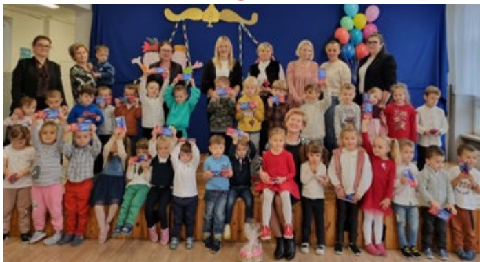
Z wizytą u przedszkolaków ze słodką niespodzianką w Szkole Podstawowej w Gnieździskach z okazji pasowania