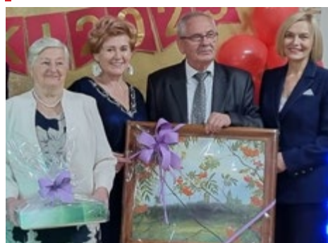
Dla uczestników przygotowano wiele atrakcji i nagród