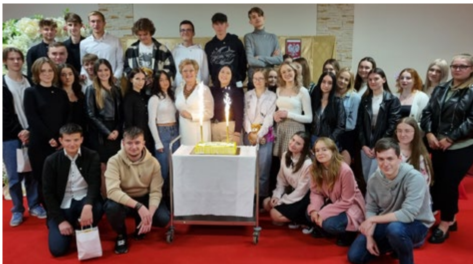
Wszechobecna radość przedstawicieli młodego pokolenia