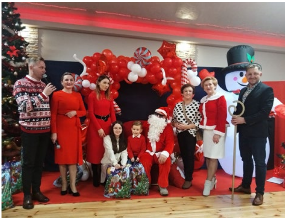
Św. Mikołaj w Łopusznie. Czas radości dla dzieci i dla dorosłych