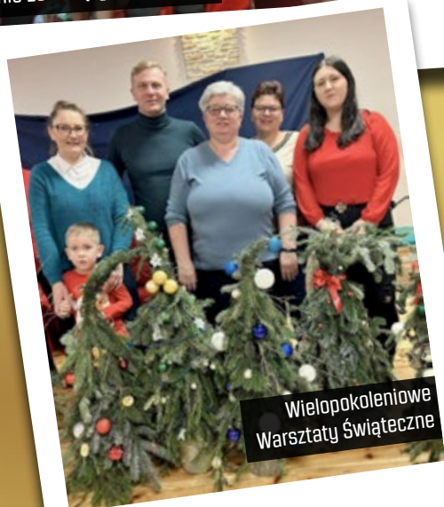
Wielopokoleniowe Warsztaty Świąteczne