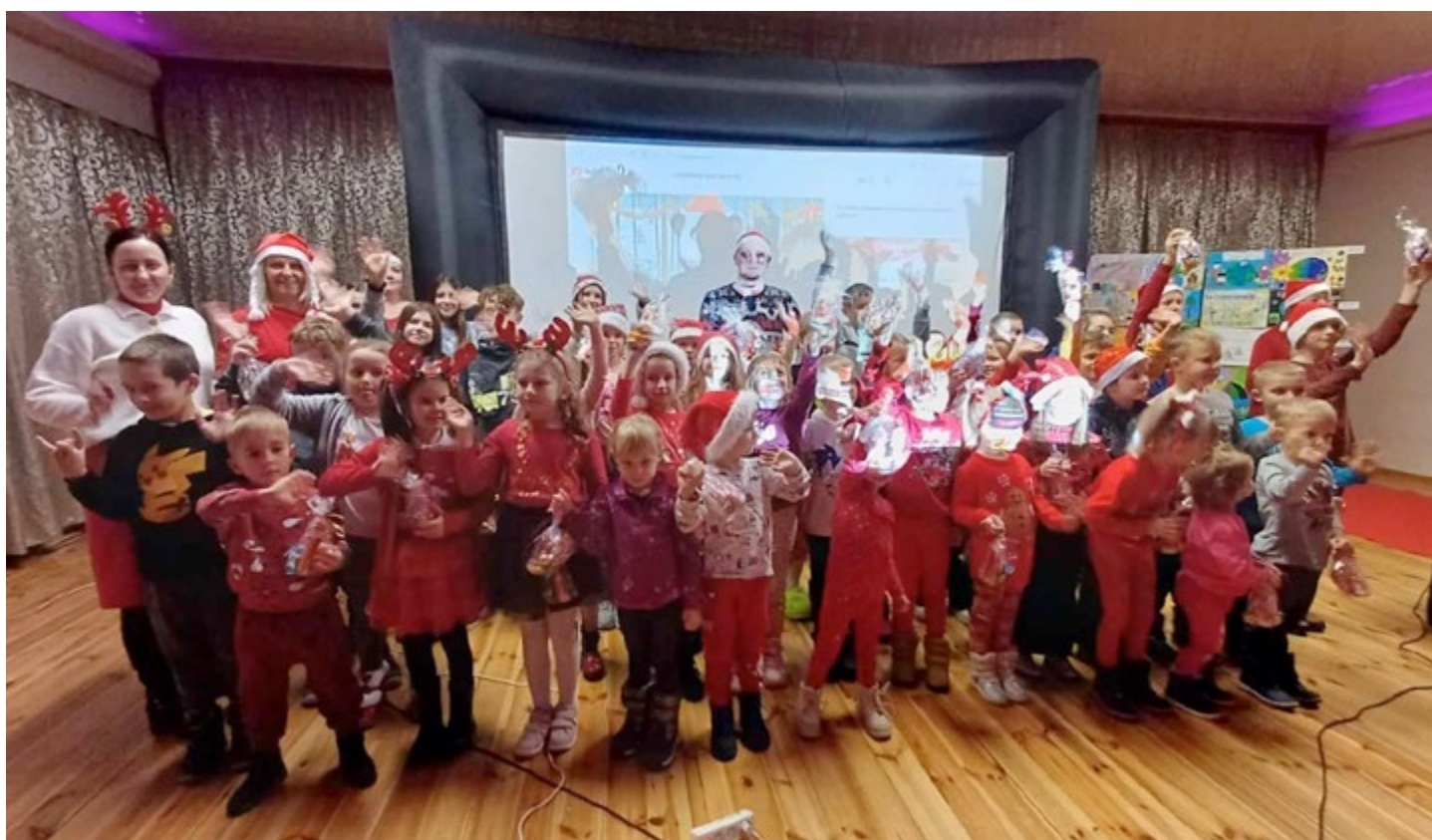
Seans przyciągnął wielu młodych kinomanów

M iejsko-Gminny Ośrodek Sportu i Rekreacji w Łopusznie po raz kolejny, w ramach warsztatów filmowych, zorganizował zajęcia dla najmłodszych – „Mikołajkowe kino”. Dla dzieci i rodziców przygotowano