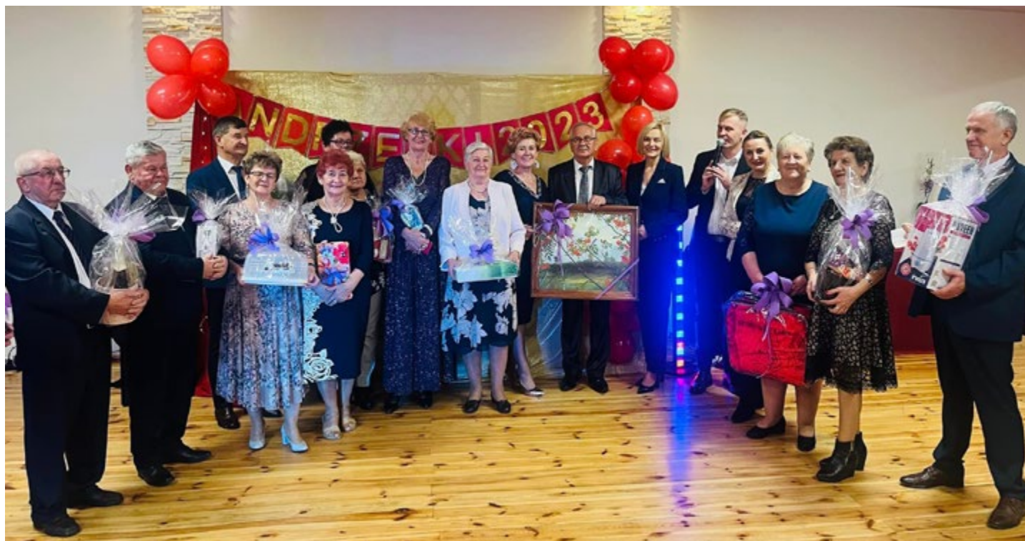
Wspaniali uczestnicy wydarzenia