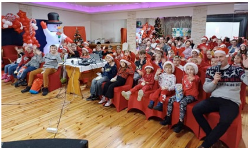
Spotkanie przeprowadzone w świątecznej atmosferze