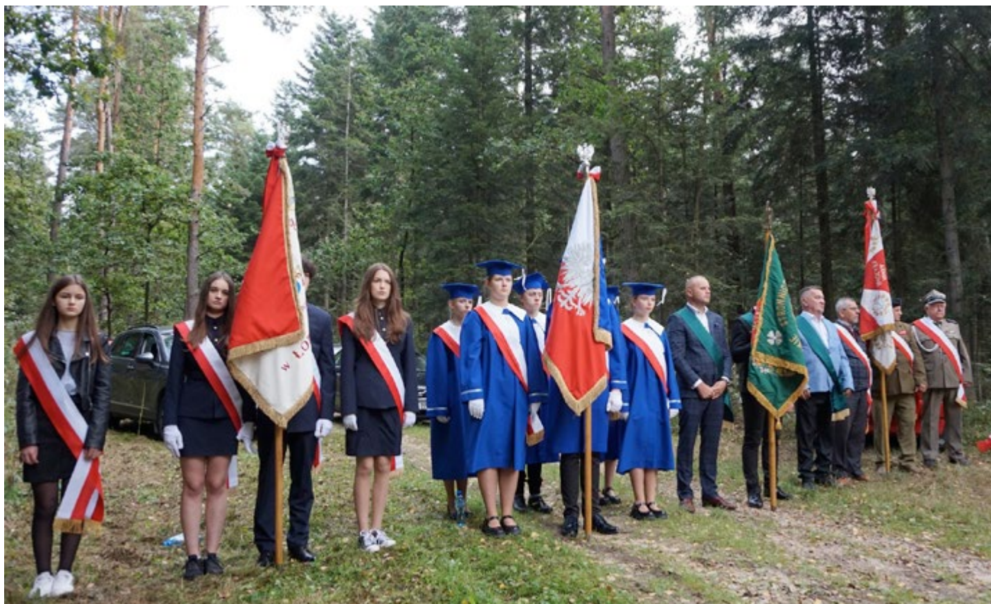
Młodzież i poczty sztandarowe uczestnikami obchodów