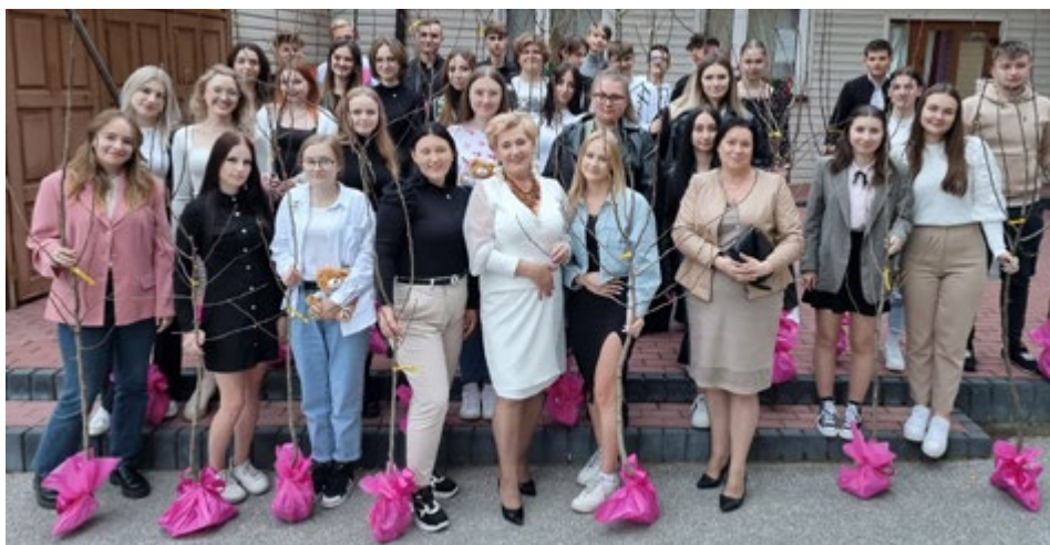
Szczęśliwa młodzież otrzymała sadzonki grusz i jabłoni