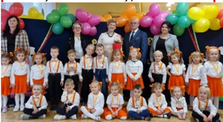
Uroczyste pasowanie na przedszkolaka dzieci ze Szkoły Podstawowej im Jana Pawła II w Łopusznie.