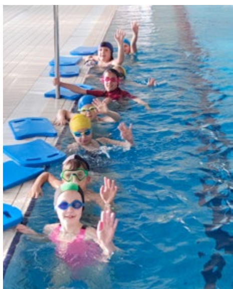
Dzieci czują się jak ryba w wodzie

W dniach od 21 września do 30 listopada 2023 r. trzydziestoosobowa grupa uczniów z klasy III i II Szkoły Podstawowej im. Stefana Żeromskiego w Gnieździskach uczestniczyła w Projekcie powszechnej nauki pływania „Umiem Pływać”, którego organizatorem był Wojewódzki Szkolny Związek Sportowy.