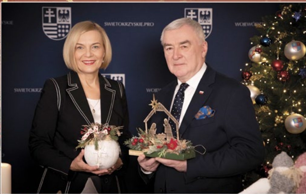
Renata Janik Wicemarszałek Województwa Świętokrzyskiego