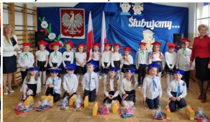
Ślubowanie uczniów ze Szkoły Podstawowej w Dobrzeszowie