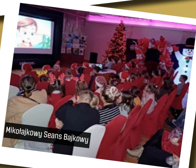
Mikołajkowy Seans Bajkowy