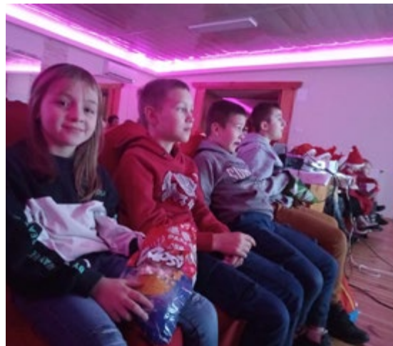
Wszechobecna radość emanowała od dzieciaków