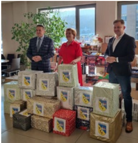
Ogromna liczba przedmiotów zebrana na szczytny cel

Dyrektorzy i wszyscy pracownicy jednostek organizacyjnych miasta i gminy Łopuszno wsparli z potrzeby serca zbiórkę przeprowadzoną w szczytnym celu. W akcję zaangażowali się również przedstawiciele młodego pokolenia. Widok postaw prospołecznych i altruistycznych wśród młodzieży z mia-