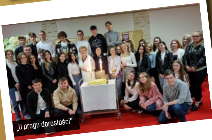
„U progu dorosłości”