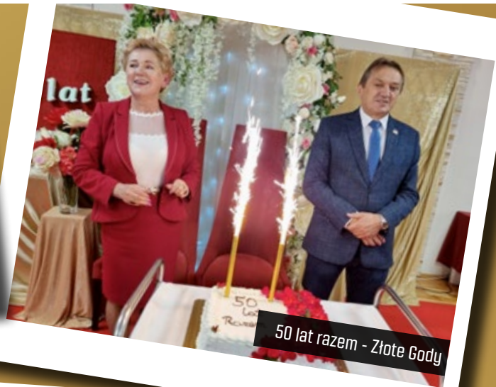
50 lat razem - Złote Gody