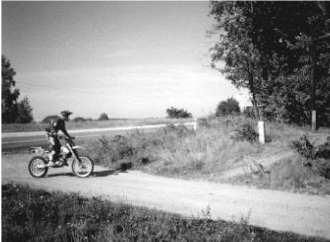
Snochowice – Zagórki. Wjazd na terasę rajdu.

Dwa odcinki specjalne przebiegały częściowo przez teren naszej gminy, a konkretnie przez miejscowości: Gnieździska, Snochowice, Józefinę, Dobrzeszów. We wsi Snochowice zlokalizowany był punkt kontrolny pomiaru czasu. Wyniki uzyskane przez zawodników przedstawiała prasa codzienna i my nie będziemy ich powielać. Chcemy jedynie poinformować, iż z wypowiedzi samych uczestników mistrzostw wynikało, że przygotowana trasa była trudna i urozmaicona.