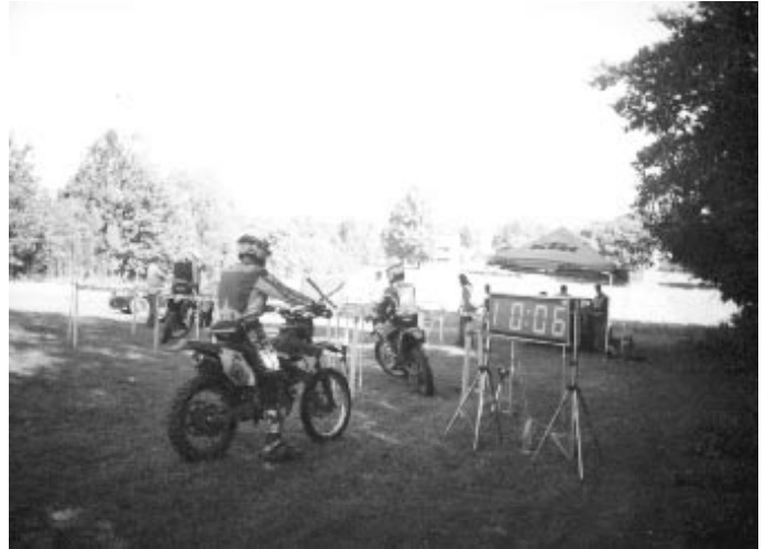
ENDURO w Snochowicach. Start z punktu pomiaru czasu.