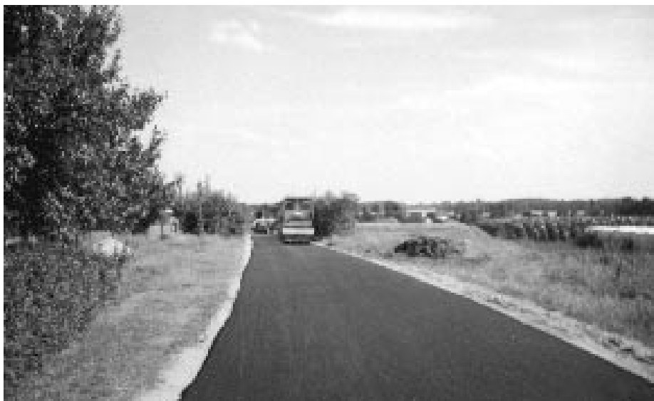
ZDJĘCIA Z GŁOWALA

Wszyscy wykonawcy wyłonieni zostali w drodze przeprowadzonych przetargów.